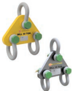
Udligningstrekanter / Compensation triangle